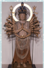
重要文化財 高成寺・千手観音立像